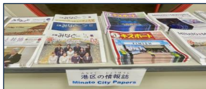
みなとく じょうほうし 港区の情報誌