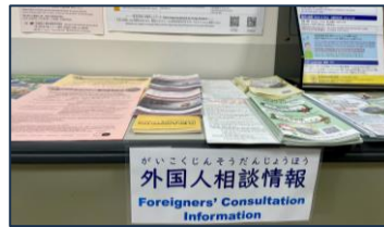
がいこくじん そうだん じょうほう 外国人相談情報