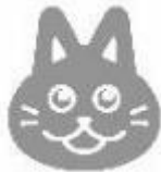
MIAキャラクター「みあ」